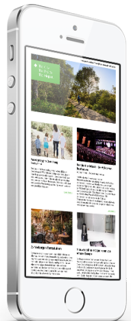
4. Digitale nieuwsbrief

één rechtenvrije foto (liggend, JPEG) zonder tekst en logo's in het beeld, tekst (maximaal 100 woorden) en URL van de detailpagina.